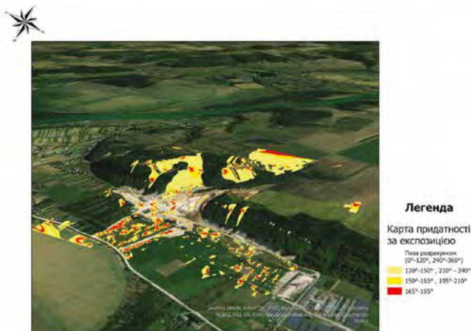
Рисунок 5. Карта придатності схилів Стриганецького кар'єру за експозицією