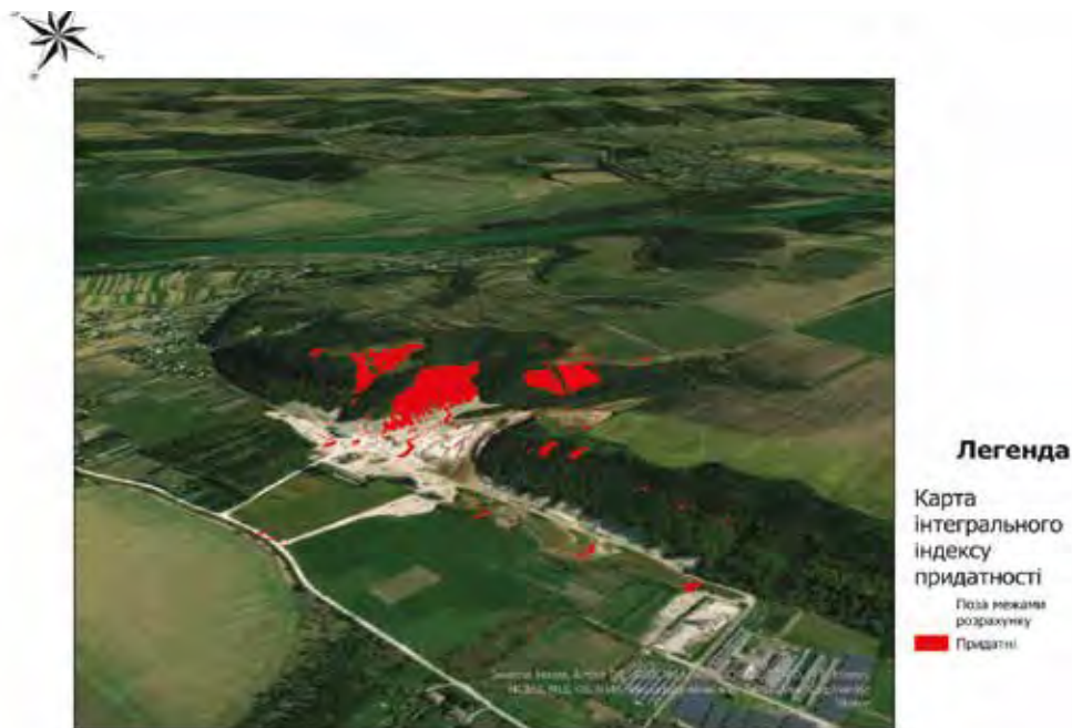
Рисунок 6. Карта інтегрального індексу придатності схилів Стриганецького кар'єру для розміщення сонячної електростанції

1. Фільтрація за площею – оскільки практичне розміщення СЕС потребує певної мінімальної площі для формування рядів панелей, полігони з високими значеннями I_{INT} було додатково відфільтровано за критерієм площі. З карти інтегрального індексу придатності виділено полігони з: – значенням I_{INT} > 0 ;