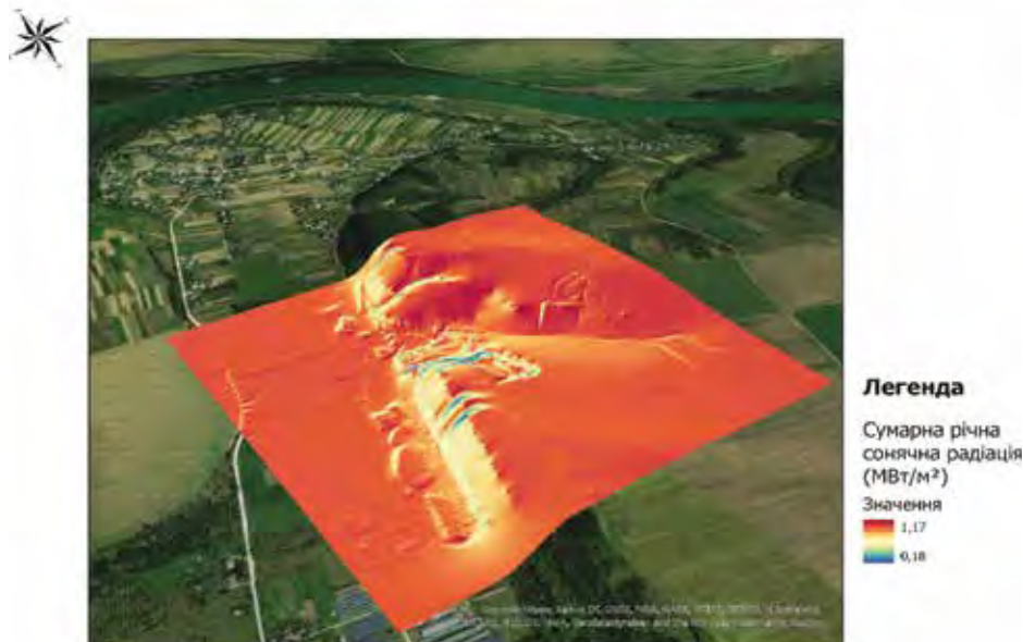
Рисунок 3. Модель сумарної річної сонячної радіації (МВт/м 2 ) для Стриганецького кар'єру

На (рис. 3) представлено просторовий розподіл сумарної річної сонячної радіації в межах Стриганецького кар'єру. Значення радіації варіюють у діапазоні приблизно від 0,18 до 1,17 МВт/м 2 , що відображено градієнтом кольорів від холодних до теплих тонів. Карта враховує геометрію схилів та затінення бортами кар'єру і слугує основою для виділення ділянок із підвищеним сонячним потенціалом для подальшого розміщення сонячних електростанцій.