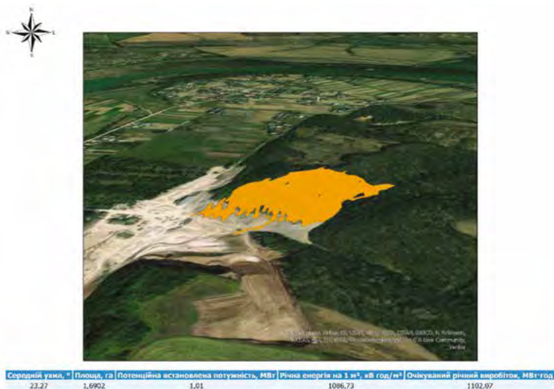
Рисунок 7. Виділена ділянка з максимальною інтегральною придатністю для розміщення СЕС у Стриганецькому кар'єрі

– площею не менше встановленого порогу (у роботі використано поріг, що дозволяє уникнути фрагментів, менших за кілька сотих гектара).