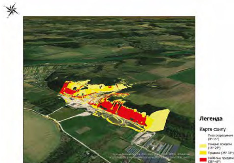
Рисунок 4. Карта класифікованих ухилів поверхні Стриганецького кар'єру

З метою оцінки придатності схилів до розміщення СЕС кожен з трьох показників – ухил, експозиція та сумарна річна радіація – класифіковано за чотирма рівнями: